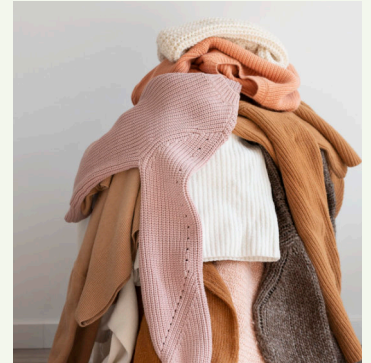
Les mer: sortere.no/tekstilpilot

Alle løsninger omfatter innsamling av både brukbare og ødelagte tekstiler. Prøveområdene er utvalgte bydeler i Fredrikstad, Bergen, Stavanger, Drammen og Trondheim. For enkelte av disse områdene vil kommunen feste en magnetplate til boksen med informasjon om pågående pilot. Innleveringen sorteres av enkelte innsamlere som har tatt på seg en jobb med å analysere kvaliteten, og senere i piloten gjennomføres en brukertilfredshetsanalyse. Funnene skal danne grunnlag for anbefalinger om framtidige løsninger for hele Norge. Prosjekteier er NF&TA og prosjektleder er konsultantselskapet Mepex. Prosjektet er støttet av Handelens Miljøfond. Vi tømmer våre Gjenbruken bokser som normalt i hele pilotperioden. Ønsker du å vite mer om piloten gå til nettsiden: sortere.no/tekstilpilot